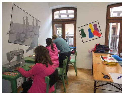
In der Schneiderei werden hübsche Handtaschen genäht.