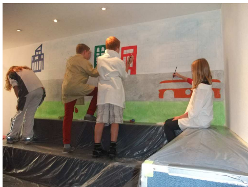
In der Malerei wird gerade ein großes Wandbild erstellt.

An dieser Stelle werden einige der vielen Betriebe vorgestellt, die in Little Lautern angesiedelt sind.