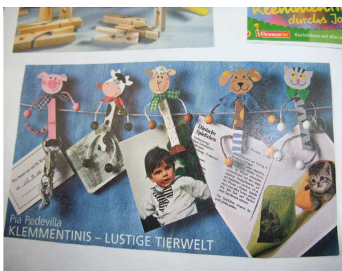
In der Holzwerkstatt werden fleißig Klammertiere gebastelt.