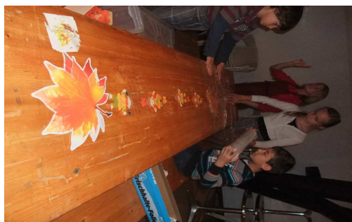
In der Kantine wird die Tischdekoration für das Mittagessen vorbereitet.

Natürlich gibt es noch viele andere Betriebe in unserer Stadt, ein paar werden in unserer nächsten Ausgabe präsentiert. (Vanessa)